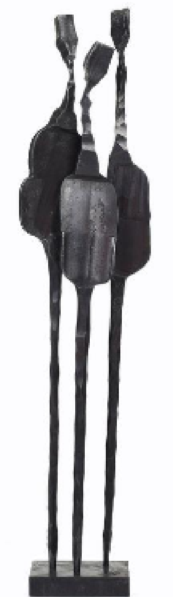
Maxime Plancque, Sans titre , sculpture en fer, 50x10x10 cm.