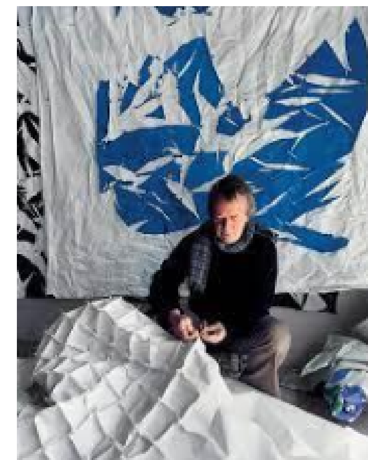
Simon Hantaï pliant une toile pour réaliser une Tabula . La peinture ne se révèle qu'au dépliage de la toile, 1975.