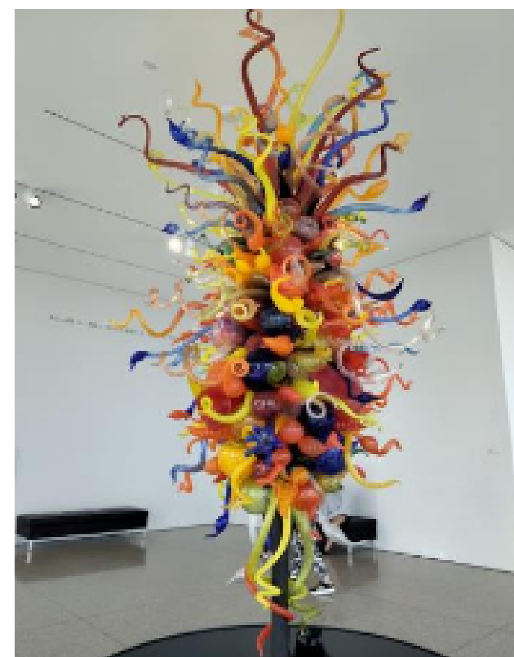
Dale Chihuly, Isola di San Giacomo in Palude Chandelier II , 2000, sculpture en verre soufflé, 464x218 x 243 cm, Musée d'art de Milwaukee.