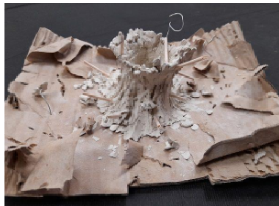
Production d'élèves, La matière s'est déchainée .