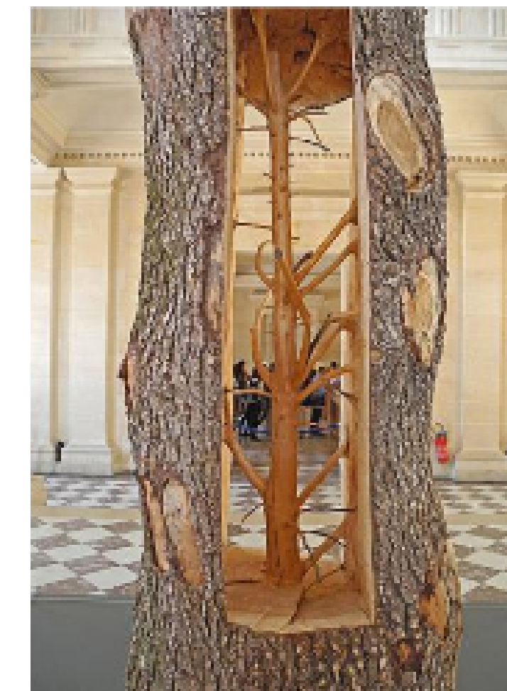
Giuseppe Penone, Arbre porte , 2012, sculpture en bois de cèdre, 316 x 105 x 105 cm.