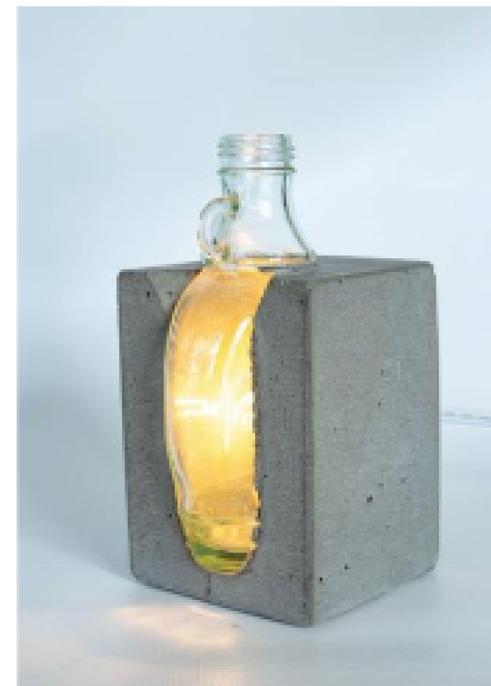
Jacques Bodart, Lampe sirop d'érable , 2020, sculpture en verre et béton.