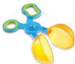
Des ciseaux à boule