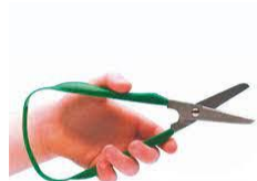
Des ciseaux easy-grip

. Manque de force ou d'endurance de la main, difficulté à dissocier les doigts ... . S'assurer de la dominance manuelle de l'enfant concerné. . Pour aller plus loin : https://www.youtube.com/watch?v=HYZOr7j48sw