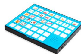
Un tableau bavard