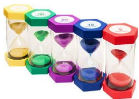
Des sabliers géants

Donner à mieux appréhender la durée d'une tâche, d'une séance