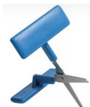
Des ciseaux presseur