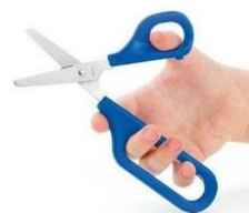
Des ciseaux à grande boucle

Proposer une réponse à un besoin particulier