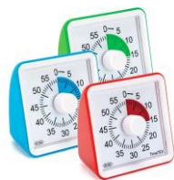
Des « teamer » (silencieux)

Donner à mieux appréhender la durée d'une tâche, d'une séance