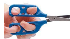
Des ciseaux à double-prise