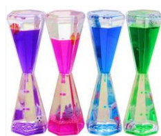
Des sabliers liquides