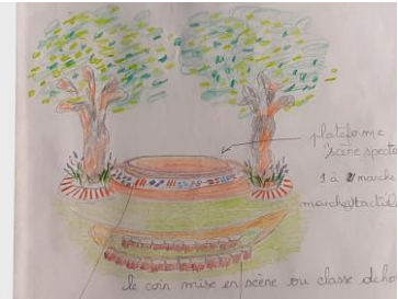
Se mettre en scène