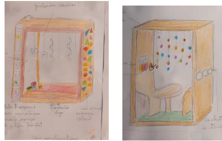
Des cabanes sensorielles – abri pour ateliers extérieurs