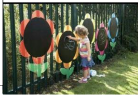
Espace des artistes