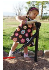
Découverte de la matière