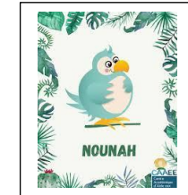
Espace bien être et réconfortant