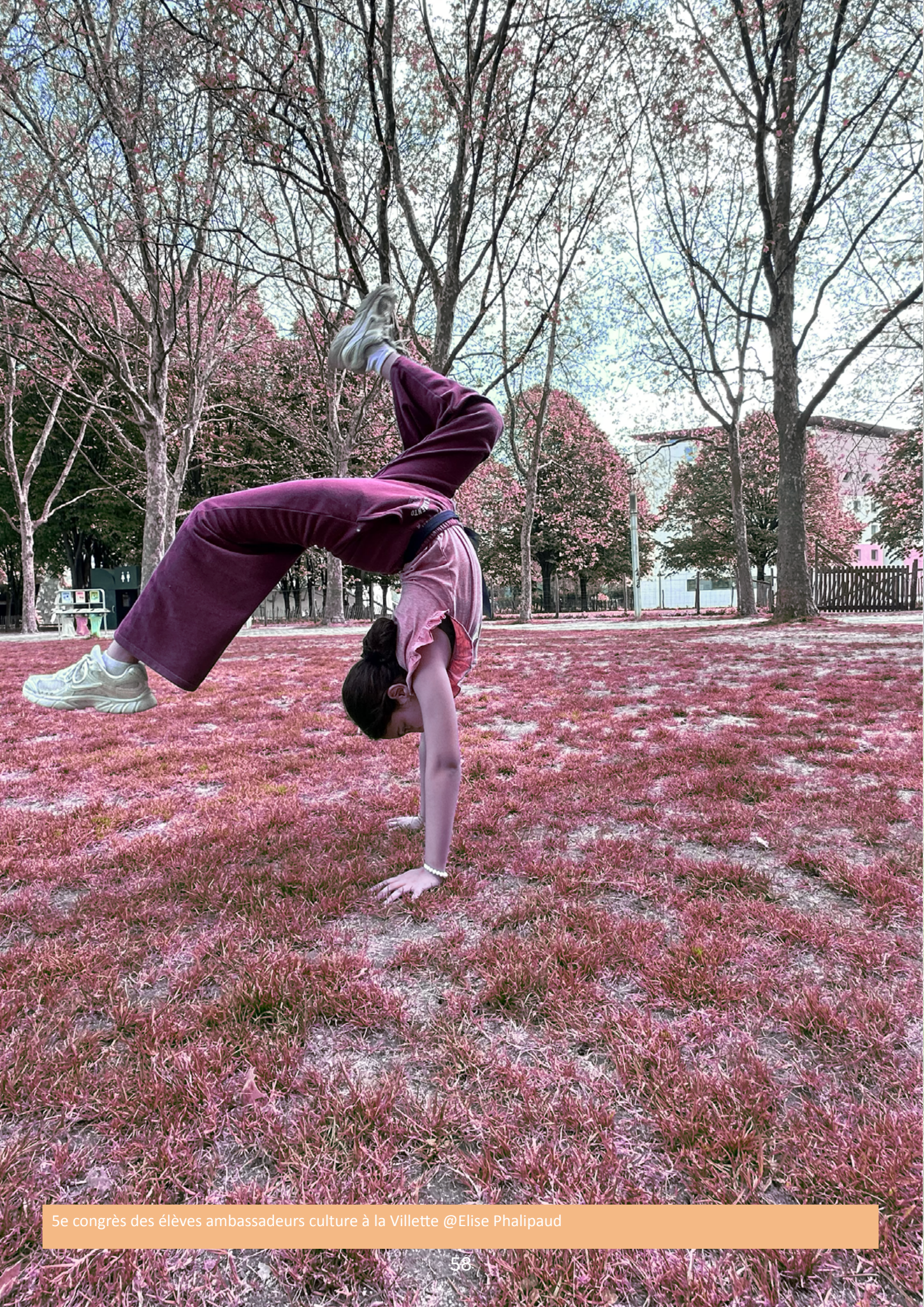
5e congrès des élèves ambassadeurs culture à la Villette