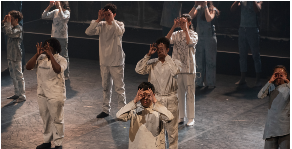
@J'adore ce que vous faites