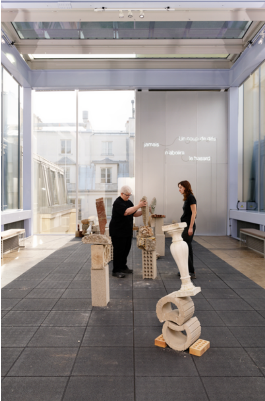
↑ Vue de l'exposition Coming Soon, oeuvre et performance de Bridget Polk