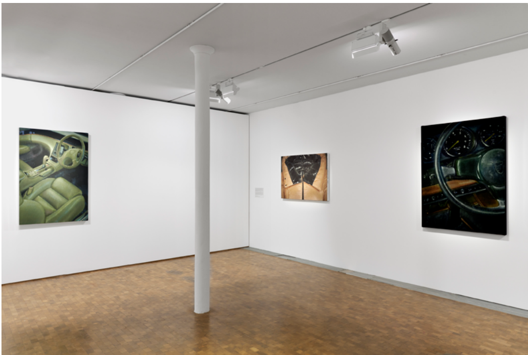
↓Vue de l'exposition Study for No de l'artiste Issy Wood