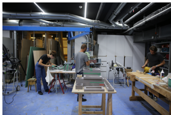
↑ Vue de l'atelier de production

Seront privilégiées les candidatures d'établissements scolaires souhaitant inscrire leur participation dans un véritable projet d'éducation artistique et culturelle , en prenant appui sur les trois piliers de l'éducation artistique et culturelle que sont l'acquisition de connaissances, la rencontre avec les artistes et professionnels de l'art ainsi que la rencontre sensible avec les œuvres contemporaines et les lieux de création et d'exposition .