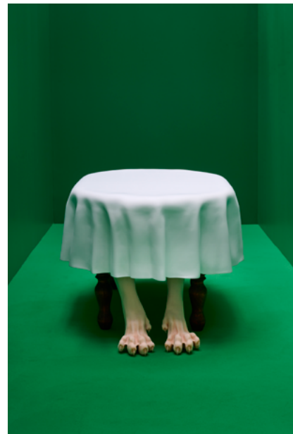
↑ Vue de l'exposition

La construction de ces parcours repose sur les piliers de l'Éducation Artistique et Culturelle : la rencontre avec les œuvres et les professionnels, les pratiques artistiques et l'acquisition de connaissances.