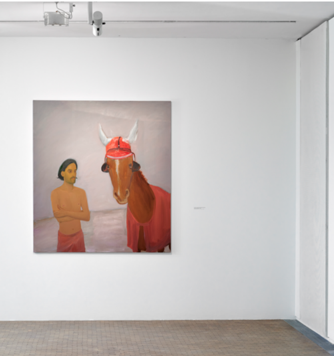
→Vue de l'exposition Seen Through Others de l'artiste Xinyi Cheng.