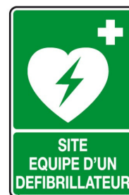
Pictogramme de signalisation

La réglementation oblige les établissements recevant du public de catégorie 1 à 4 à s'équiper d'un défibrillateur automatisé externe. L'Observatoire recommande de les installer dans tous les établissements d'enseignement, à des emplacements adaptés, connus de tous et en nombre suffisant.