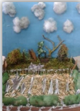
Diorama ou maquette de reconstitution historique du champ de bataille.

Revivre le quotidien de Goussainville en 1918 avec des ateliers menés par des classes de CM2 et les archivistes itinérants du CIG.