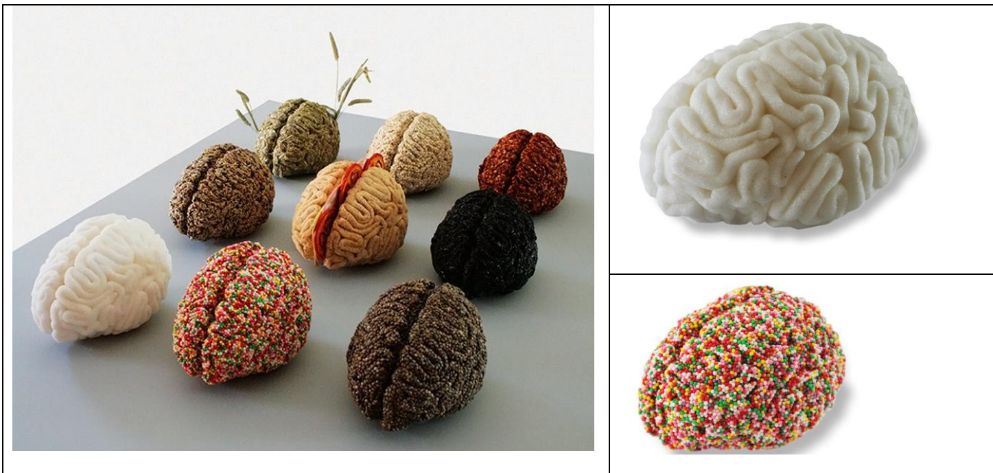
Sara ASNAGHI sculpte des cerveaux en sucre, céréale, bonbon, graine...