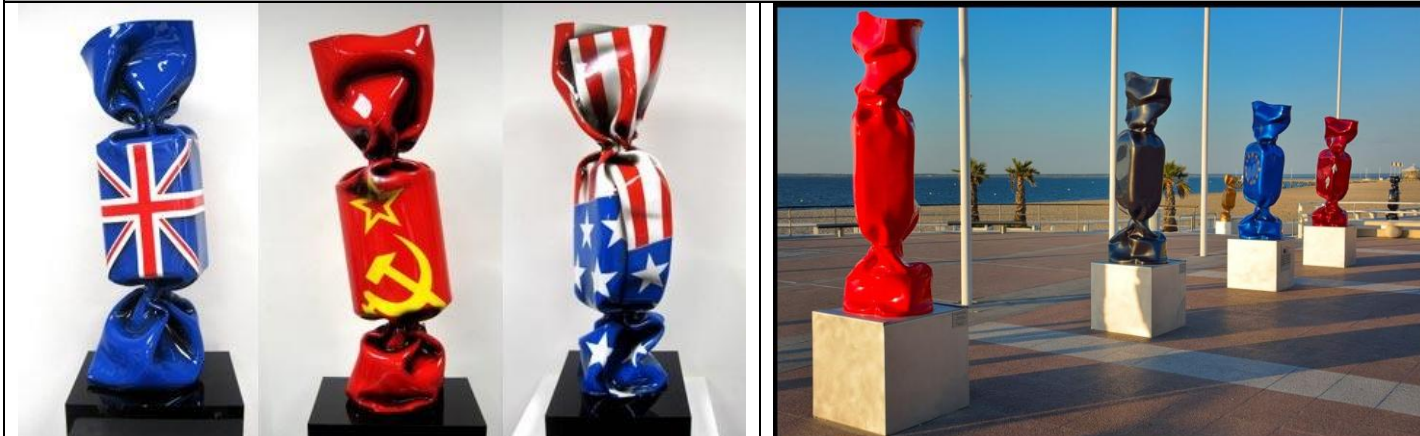
Laurence Jenkell installe ses bonbons géants dans des lieux de pouvoir. La gourmandise comme vecteur de paix, de concorde, de sensations positives.