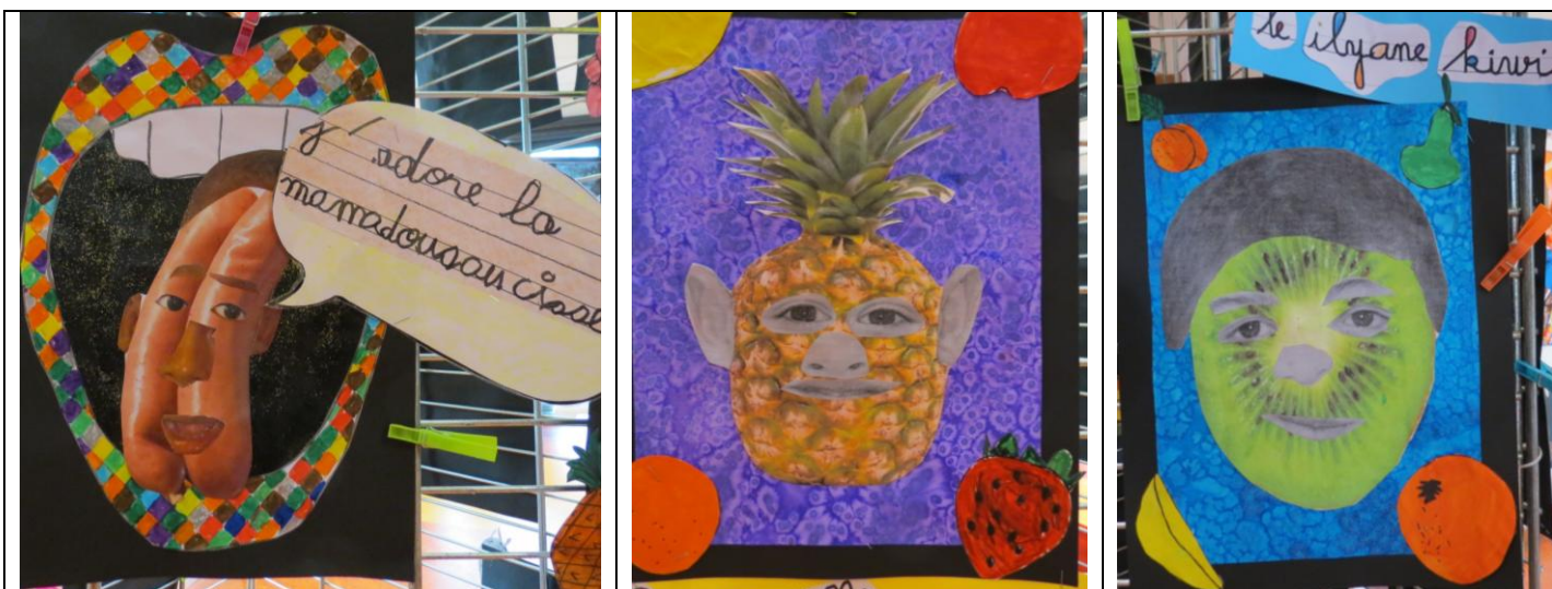
Travail d'élèves de maternelle (exposition « gourmandise » école Anne Franck Argenteuil)