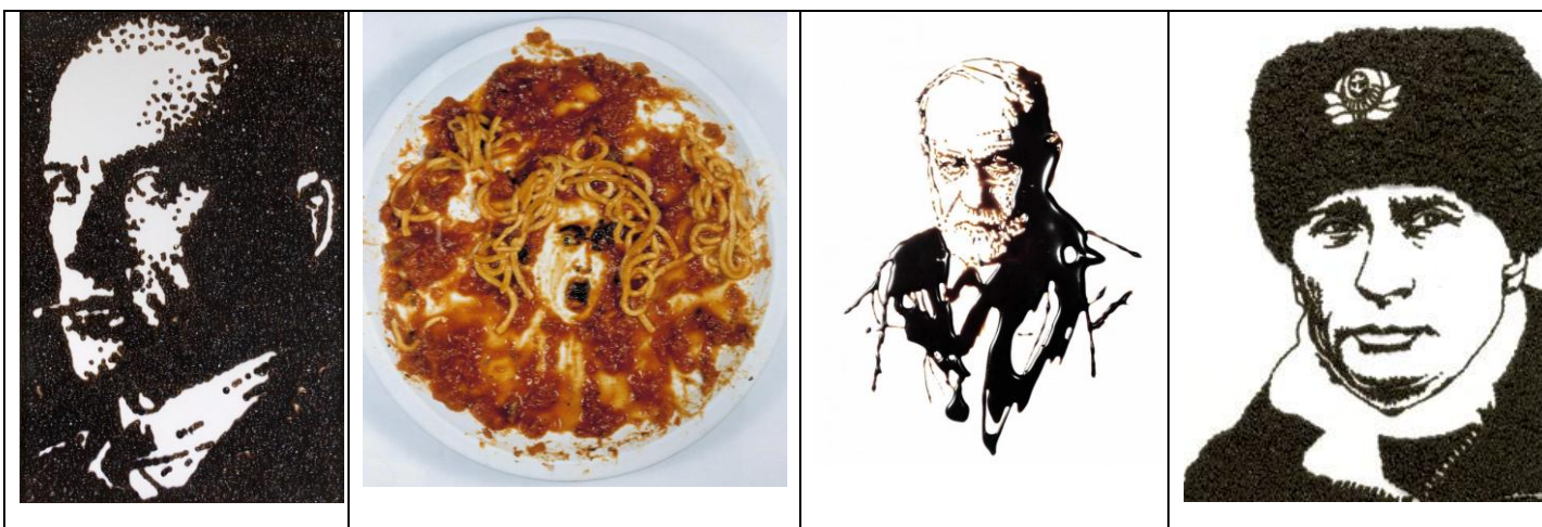
Vik Muniz utilise chocolat (Victor Hugo), caviar (Maïakovski, Poutine) ...spaghetti, ketchup