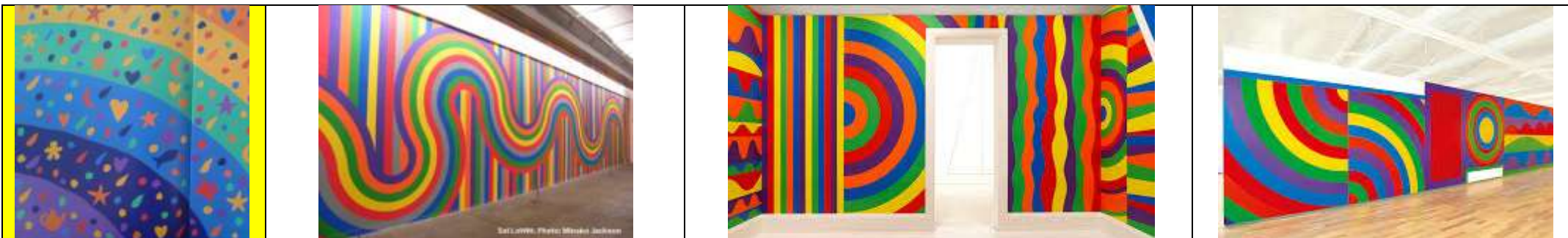
Dernières pages du Rêve de Mimi