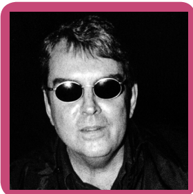
D. Jochaud / Gallimard