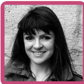
C. Hélié / Gallimard