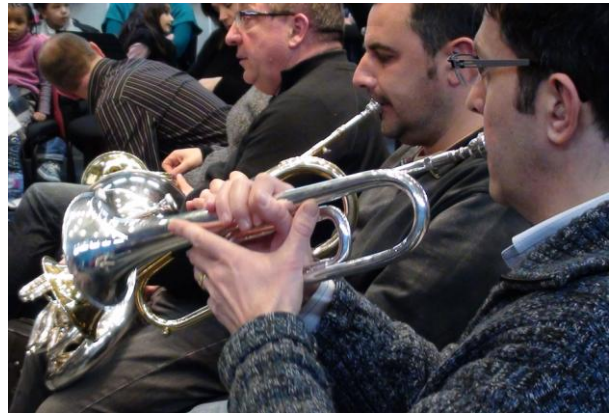
trompettes de cavalerie